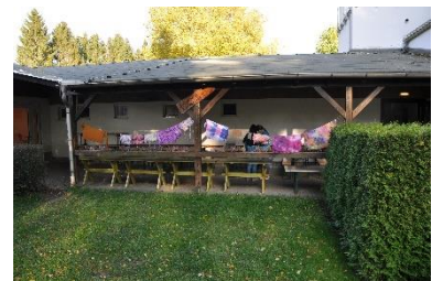
Kreatives Gestalten von Textilien bei schönstem Wetter direkt in der Unterkunft Tabakstanne Thalheim: hier beim Batiken.