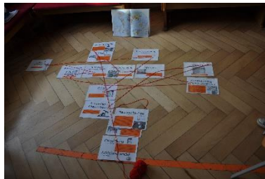
Textilralle: Die Weltreise einer Jeans, Heranführen an die Problematik der globalen Lieferketten sowie der sozialen und umweltbezogenen Herausforderungen + Suche nach Lösungsansätzen.