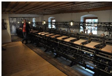
Strumpfmuseum in Gellenau: Textilgeschichte und Industrialisierung, Entwicklung eines starken Maschinenbaus in Chemnitz.