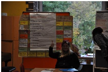
Ankommen: Tages- und Wochenplanung für das Camp in Thalheim vom 18. bis 24.10.2021

An dieser Stelle sollen ausgewählte Eindrücke in Form von Fotos, die während der sechs Tage entstanden sind, einen Einblick in die Umsetzung des Camps geben.