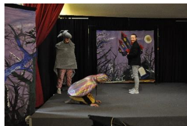
Die Teilnehmenden schlüpfen in Kostüme und übernehmen eine Rolle.