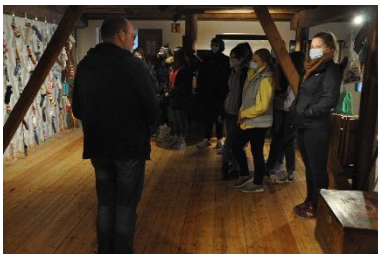
Führung im Strumpfmuseum in Gellenau: zur Textilgeschichte der Region um Chemnitz.