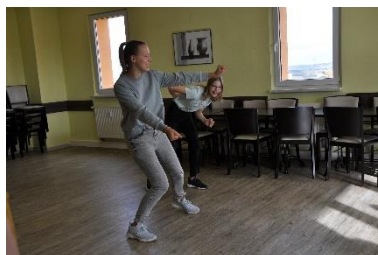
Im Kinder- und Jugendtheater Burattino in Stolpen: Warm-up und Improvisation beim Rollenspiel.