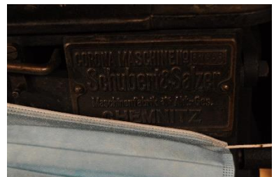
Strumpfmuseum in Gellenau: Corona-Maschinen aus Chemnitz in Corona-Zeiten: Das Camp war bestimmt von besonderer Vorsicht und Vorsorge wegen Corona.