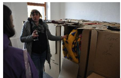
Im Fundus des Kinder- und Jugendtheaters Burattino, welches derzeit neu auf der Burg Stolpen eingerichtet wird.